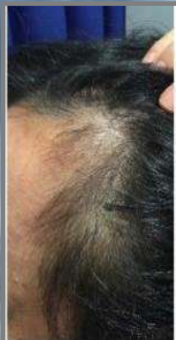
3週間に1回 4回施術3週間後