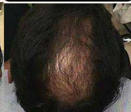
2週間に1回 4回施術2週間後